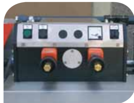
Comandi regolazione testa Controls for head adjustment Control de regulación cabeza