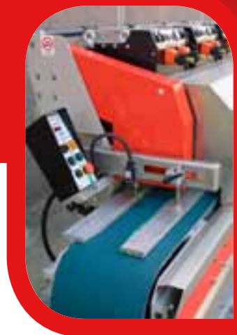
Entrata macchina Machine entrance Entrada maquina