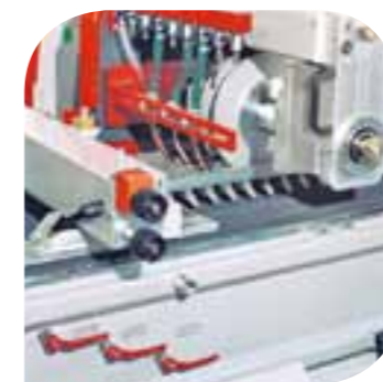
Comandi sul lato operatore Controls are on operator side Mandos en la parte del operador