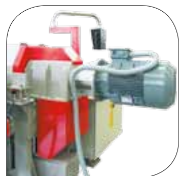
Versione TD TD Version Versión TD