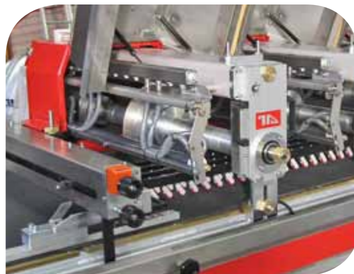
Fissaggio testa a telaio per versioni FS 940 - FS 1300 Device for securing head to frame for version FS 940 - FS 1300 Sujetador del cabezal de corte al bastidor para version FS 940 - FS 1300