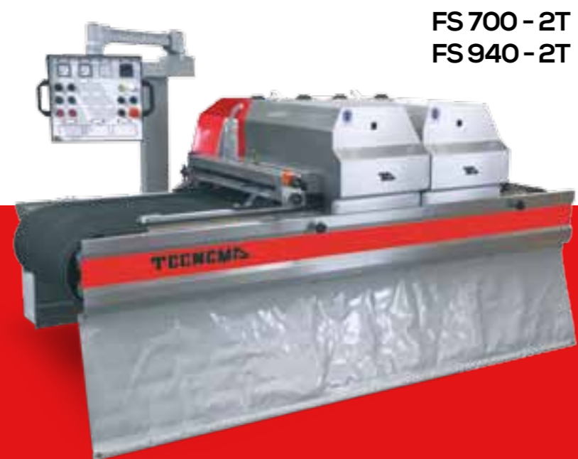
FS 700 - 2T FS 940 - 2T