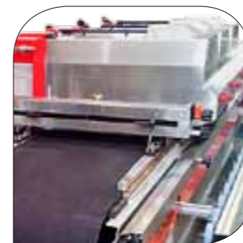
Gruppo supporto a sbalzo Protruding support unit Soporte voladizo grupo