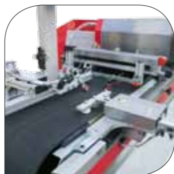
Centratore Centre square Escuadra de centrar