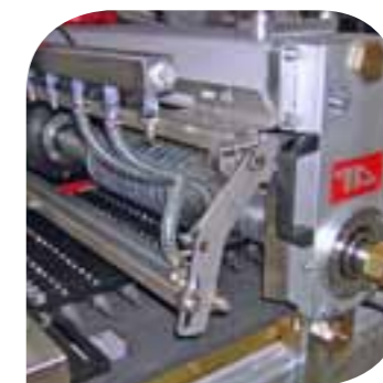
Spruzzatore per mosaici Spraying device for mosaics Grupo agua para mosaico