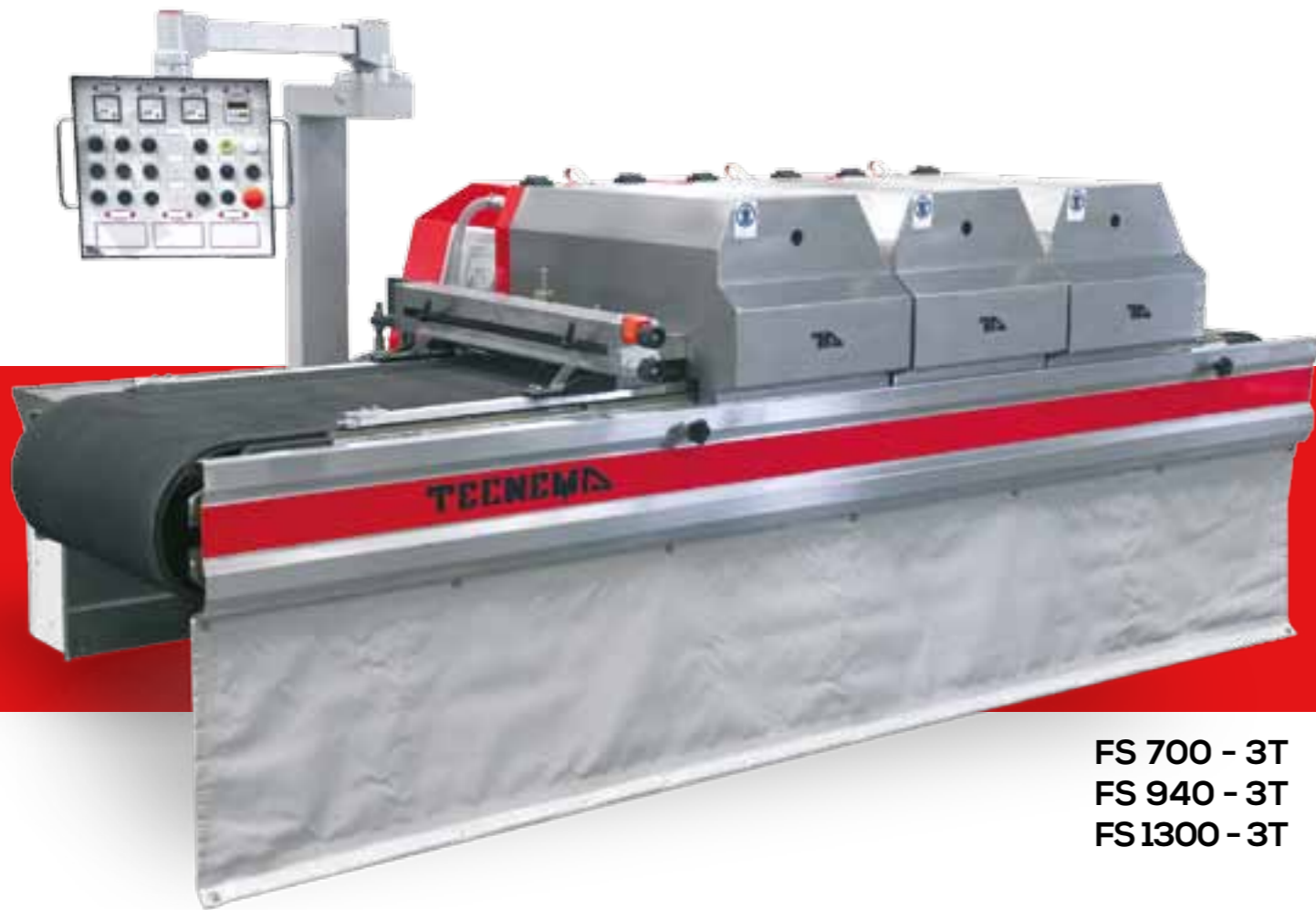
FS 700 - 3T FS 940 - 3T FS 1300 - 3T