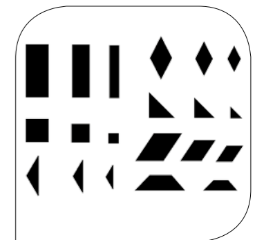
Forme ottenibili Obtainable shapes Formas realizables